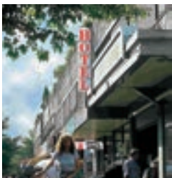
Hotel Århus, Hamburg- Neugraben