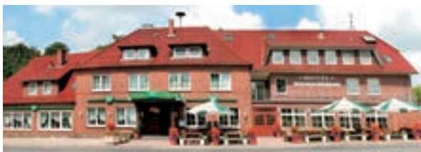
4 Hotel Böttchers Gasthaus, Rosengarten-Neendorf

Der Wildpark Schwarze Berge im Süden von Hamburg ist ein beliebtes Ausflugsziel für Groß und Klein. Besonders beliebt sind die Hängebauchschweine - das Empfangskomitee des Wildparks. Die bewaldete Parkanlage ist außerdem besonders im Wildpark Schwarze Berge, Täler und Seen gestalten die Landschaft. Auch für Gruppen bietet der Park besondere Angebote: Ob Kindergeburtstag, Betriebsausflug oder Schulklassenausfahrt - das Natur-Erlebnis-Zentrum im Wildpark Schwarze Berge e.V. bietet eine Vielzahl an attraktiven Programmen.