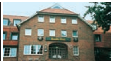
11 Gasthof Braaker Krug, Braak/Hamburg