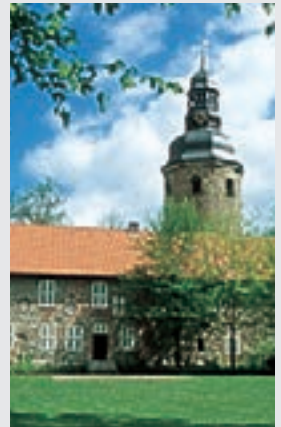
Museum Kloster Zeven

Tennis, Squash, Schwimmen, Reiten, Wandern, Radwandern, Wasserwandern, Angeln, 2 moderne Campingplätze, Trimm-Dich-Pfad, Waldlehrpfad, Abenteuerspielplatz, Grillplatz, Mountainbike-Parcours.