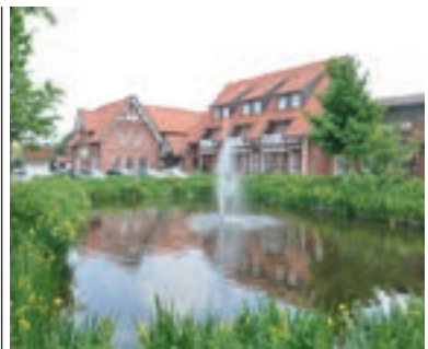
16 Hotel-Restaurant Schützenhof, Ahlerstedt

Die Stadt Buchholz ist eine liebenswerte (Klein-)Stadt im attraktiven Süden von Hamburg. Mit rund 40.000 Einwohnern ist Buchholz die größte Stadt im Landkreis Harburg und anhaltend beliebt bei neuen Mitbürgerinnen und Mitbürgern. Umgeben von reizvollen Landschaften liegt die Stadt Buchholz mit direkter Autobahnanbindung nahe zur Weltstadt Hamburg. Diese Lagegunst ermöglicht schnelle Verbindungen in die Metropolregion Hamburg. Auch Bremen und Lüneburg sind in weniger als einer Stunde Fahrzeit zu erreichen. Die Stadt selbst bietet Ihnen eine komplette Infrastruktur.