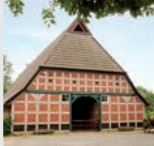
Heimatmuseum, Rotenburg

Den Kulturpfad Rotenburg muss man erleben. Auf der Reise durch Zeit und Raum begegnet man der Geschichteten Rotenburgs, die auf eine Burg der Bischöfe von Verden zurück geht. Beginnen Sie den Pfad am Rathaus mit dem Pferdemarkt. Beim Weitergehen entdecken Sie wunderschöne Fachwerkhäuser, Skulpturen, Museen und Kirchen – jeder Anlaufpunkt des Kulturpfads erzählt eine eigene Geschichte.