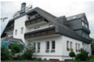
11 Zenner's Landhotel, Newel