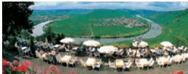
12 Hotel Zummethof, Leiwen-Trittenheim