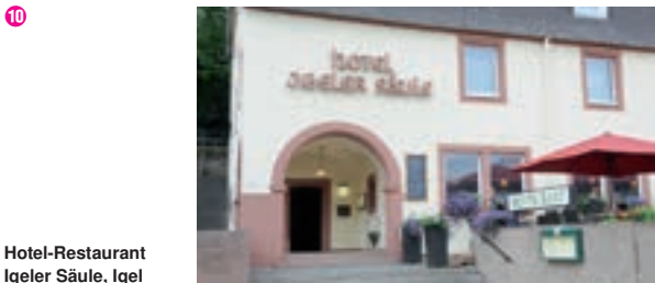
Hotel-Restaurant Igeler Säule, Igel

8 D-54531 MANDERSCHEID A 48/A 1 ab Ausfahrt 122 Manderscheid und A 60 ab Ausfahrt 8 Spangdahlem Hotel Café Restaurant Heidsmühle ☆☆☆ Familienbetrieb, 42 B, EZ € 50,-, DZ € 88,-, Pauschalangebote, inkl. Frühstück, alle Zi mit Du, WC, ☎, TV und kostenfreiem WLAN, Lift, Restaurant durchgehend ab 11.30 Uhr geöffnet, ☎, ☎, ☎, P, Mosenbergstr. 22, @, www.heidsmuehle.de, ☎ +49 6572 747, Fax 530.