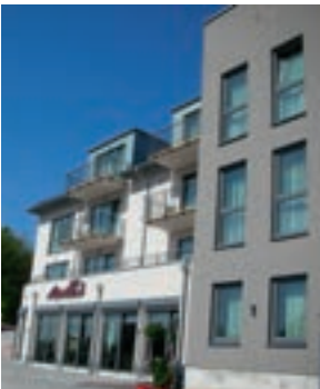
8 Müller's Landhotel, Mespelbrunn-Hessenthal