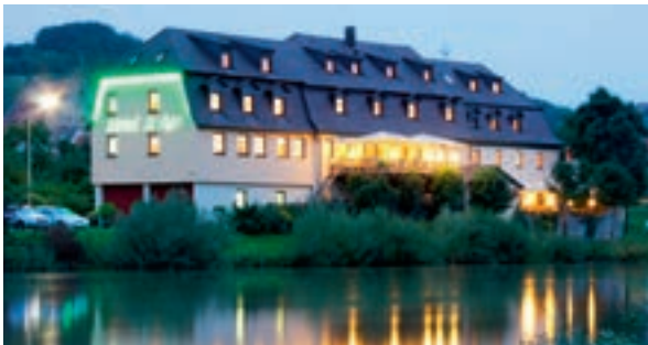
34 Hotel-Gasthof Anker, Sommerhausen

Auf seidenen Kissen und wenigen Stuhlreihen direkt über der Strasse im Turm sitzend, erleben Sie immer wieder neue, aufregende Stücke junger Autoren – Heiteres – skurril und schwarzhumorig, aber auch Ernstes, auf alle Fälle Stücke, die berühren und unter die Haut gehen. Das Torturmtheater ist ein Wallfahrtsort für Theaterfreunde, die das Besondere lieben.