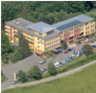
5 Landhotel Klingerhof, Hösbach-Winzenhohl

11 D-63879 WEIBERSBRUNN A 3 ab Ausfahrt 63 Weibersbrunn 500 m rechts Gasthaus Metzgerei Jägerhof ☆☆☆ komplett renoviert, 60 B, EZ € 50,- bis 68,-, DZ € 70,- bis 95,-, Juniorsuiten, inkl. Frühstücksbuffet, Zi mit Du, WC, Fön, Kosmetikspiegel, TV und WLAN, Lift, eigene Schlachtung und Wurstherstellung, Räume bis 350 Personen, große Sonnenterrasse, ☎, ☎, ☎, G, P, Hauptstraße 223, @, www.hoteljaegerhof.de, ☎ +49 6094 361, Fax 1054.