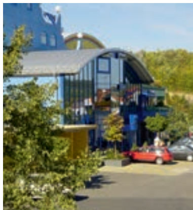
12 Hotel Strohofer, Geiselwind

9 D-97355 PRICHSENSTADT A 3 ab Ausfahrt 75 Wiesentheid ca. 7 km Gasthaus Grüner Baum ☎ 10 B, EZ € 48,-, DZ € 65,-, inkl. Frühstück, alle Zi mit Du, WC, TV und WLAN, gutbürgerliche Küche, fränkische Spezialitäten, Spargel und Fisch saisonbedingt, Gastraum für 50 Personen, Nachtwächterstube für 50 Personen, ☎, P, Schullinstraße 14, @, www.gasthaus-gruener-baum.com, ☎ +49 9383 1572, Fax 2672.