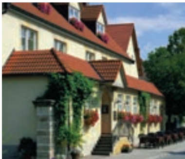
25 Flair-Hotel Brauerei-Gasthof „Zum Löwenbräu“, Adelsdorf-Neuhaus

Ausfahrt Geiselwind: Vergnügen eigener Art bietet Ihnen und den Kindern das Freizeit-Land Geiselwind. „Bayerns stärkstes Stück Freizeit“ bietet seit 1969 rasante Fahrattraktionen, faszinierende Show-Programme, wunderschöne Tierpräsentationen sowie Lehrreiches und Außergewöhnliches auf 400.000 Quadratmetern.