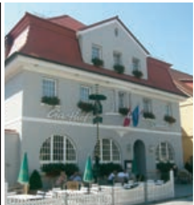
19 Hotel & Gasthof „Zum Storch“, Schlüsselfeld

Lassen Sie Ihren Gastgeber wissen, dass Sie gerne mit Links+Rechts der Autobahn reisen.