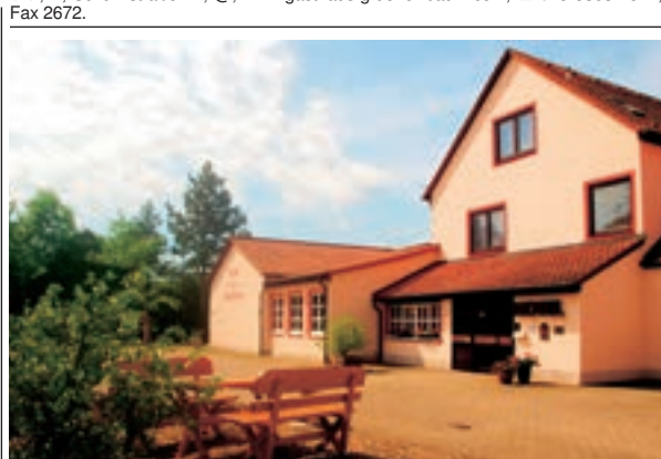
5 Flair-Hotel Zum Benediktiner, Münsterschwarzach