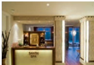
7 Hotel Reblingerhof, Bernried-Rebling