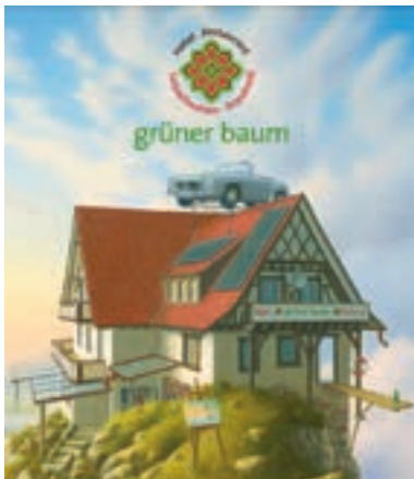
31 Gasthof Grüner Baum, Sasbachwalden-Brandmatt