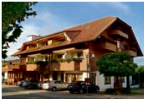
10 Hotel-Restaurant-Vinothek Lamm, Bad Herrenalb-Rotensol

Hotel-Restaurant-Vinothek Lamm ★★★★★ 50 B, 52 B, EZ € 60,- bis 105,-, DZ € 118,- bis 128,-, Suiten € 150,- bis 175,-, inkl. Frühstücksbuffet, alle Zi mit Du, WC, TV, kostenfreiem WLAN, Safe und Balkon, Lift, regionale Küche, gemütliche Bauern- und Schwarzwaldstube, eigene Brennereiprodukte, Weinkeller mit Vinothek, Konferenzraum, Terrasse, G, P, Mönchstr. 31, schwemmle@lamm-rotensol.de, www.lamm-rotensol.de, ☎ +49 7083 9244-0, Fax 9244-44.