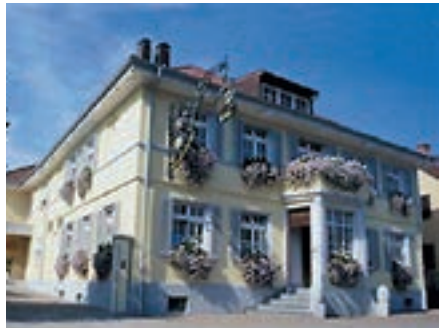
Landgasthof Kranz, Ohlsbach