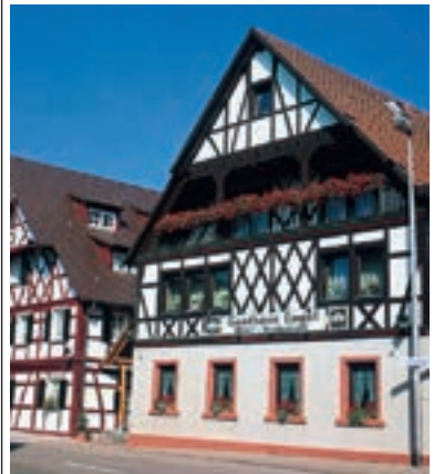
19 Hotel-Restaurant Gasthaus Engel, Rheinmünster-Schwarzach

A 5 ab Ausfahrt 52 Bühl ca. 1500 m Kohler's Hotel Speiselokal Engel ★★☆☆ 60 B, EZ € 54,- bis 76,-, DZ € 82,- bis 104,-, inkl. Frühstücksbuffet, alle Zi mit Du, WC, ☎ und Kabel-TV mit Sky, ganztägig warme Küche, Erlebnisgastonomie, Tagungsräume, ☎, Vimbacher Str. 25, @, www.engel-vimbuch.de, ☎ +49 7223 9399-0 , Fax 9399-20.