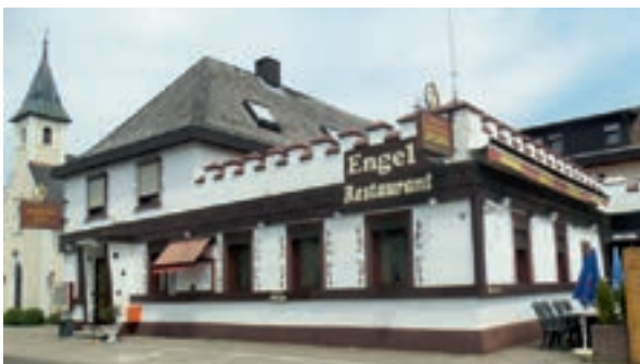
17 Hotel Restaurant Landgasthof Engel, Bühl-Oberbruch

Gasthof Krone ★☆☆ 18 B, EZ € 49,-, DZ € 85,-, inkl. Frühstück, alle Zi mit Du, WC, ☎, TV und WLAN, saisonale kreative Küche mit badisch-böhmischem Anklang, Sommergarten mit uriger Scheune, P, Seestraße 6, pavel@pospisils-krone.de, www.pospisils-krone.de, ☎ +49 7223 9360-0 , Fax 9360-18.