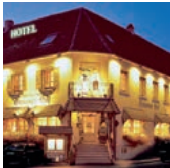
Hotel-Restaurant „Hanauer Hof“, Appenweiler