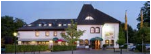
3 Landidyll Landhotel Saarschleife, Mettlach

16 Reinsfeld und Leiwen-Tritthenheim siehe Route 1.6