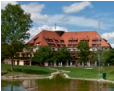
22 Flair Park-Hotel Ilshofen, Ilshofen

31 D-74199 UNTERGRUPPENBACH A 81 ab Ausfahrt 11 Heilbronn/Untergruppenbach ca. 400 m Gästehaus „Hartwig“ (☆☆) 17 B, EZ € 44,-, DZ € 74,-, inkl. reichhaltigem Frühstück, Zi mit Du, WC und WLAN, gemütlicher Aufenthaltsraum, ☎, P, Happenbacher Str. 88, @, www.hotel-hartwig.de, ☎ +49 7131 702333, Fax 70781.