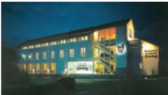
19 Hotel-Restaurant-Café Günzburg, Eschental