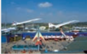
Auto &amp; Technik Museum, Sinsheim

Zahlreiche Sehenswürdigkeiten wie das Auto & Technik Museum, das Stadt- und Freiheitsmuseum und das Friedrich der Große Museum und zukünftig die Badewelt spiegeln ein lebendiges Sinsheim wieder und ziehen Touristen aus Nah und Fern an. Das Auto & Technik Museum mit den beiden einzigen jemals in Serie gebauten Überschall-Passagierflugzeugen der Welt, der russischen Tupolev Tu-144 und der französisch-britischen „Concorde“ der Air France.