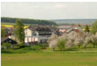
15 Flair Hotel Landgasthof Roger, Löwenstein-Hösslinslüz