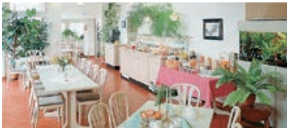
10 Hotel-Gasthof „Zum Rössle“, Heilbronn-Frankenbach

A 6 ab Ausfahrt 36 Heilbronn-Untereisesheim ca. 3 km Hotel-Gasthof „Zum Rössle“ ☆☆☆ 130 B, EZ ab € 64,-, DZ ab € 84,-, 3-Bett-Zi € 108,-, inkl. reichhaltigem Frühstücksbuffet, alle Zi mit Du, WC, ☎ und Kabel-TV, Abendrestaurant, gute bürgerliche Küche, großer P, Saarbrückener Straße 2, @, www.roessle-frankenbach.de, ☎ +49 7131 9155-0, Fax 9155-13.