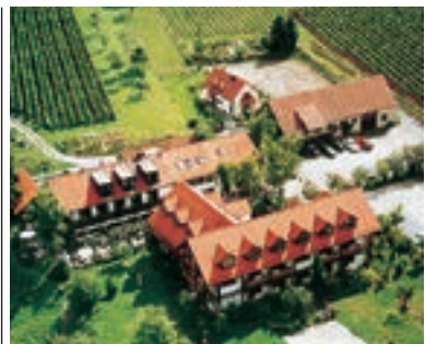
13 Hotel und Gutsgaststätte Rappenhof, Weinsberg