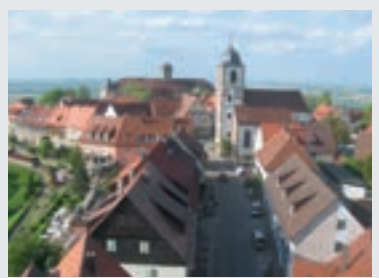
Blick vom Bergfried auf den Waldenburger Ortskern

Luftkurort in Mittelgebirgsklima hoch über der Hohenloher Ebene. Mittelalterliche Stadtbefestigung, begehrter Stauferturm, herrliche Aussichtslage.