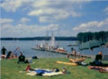
Badespaß am Rothsee

Auch der Winter hat im Fränkischen Seenland seine Reize: Schlittschuhlaufen, Eisstockschießen oder Skilanglauf. Viele Sportanlagen sowie Golf- oder Tennisanlagen laden ebenfalls zum Zeitvertreib ein.