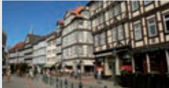
Altstadt, Hannover

Besuchen Sie Hannovers Wahrzeichen ohne den „roten Faden“ zu verlieren: Von der Tourist-Information bis hin zum Ernst-August-Denkmal zeigt eine rote