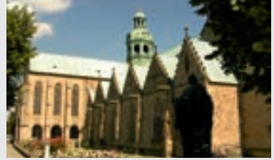
Mariendom zu Hildesheim