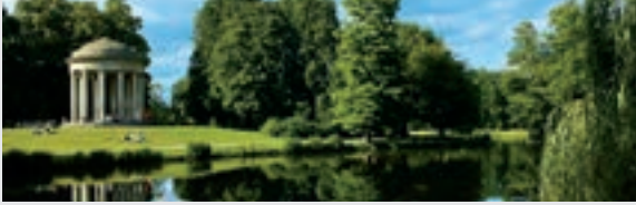
Herrenhäuser Gärten, Hannover

Sie gehören zu den schönsten Parkanlagen Europas: Seit über 300 Jahren stehen die Herrenhäuser Gärten für (Garten-)Kunst und Kultur auf höchstem Niveau. Als fast unverändertes Beispiel eines barocken Gartens beeindruckt der Große Garten mit formalem Grundriss, prächtigem Parterre, Wasserspielen und der von Niki de Saint Phalle farbenfroh gestalteten Grotte. Die einstige Sommerresidenz der Welfenfürsten vermittelt noch heute ein fürstliches Lebensgefühl. Für Garten- und Pflanzenliebhaber gibt es im Berggarten viel zu entdecken. Rund 11.000 verschiedene Pflanzenarten gedeihen in einem der ältesten Botanischen Gärten Deutschlands. In seinen Schauhäusern sind unter anderem bis zu 800 blühende Orchideen ausgestellt. Eine faszinierende Unterwasserwelt und über 6.000 tropische Pflanzen lassen sich im Sea Life Aquarium inmitten des Berggartens entdecken.