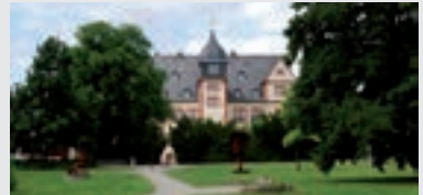
Schloss Salder, Salzgitter

Schon Schloss Salder weist es nach – Salzgitter ist trotz seines Gründungsjahres 1942 keine Stadt aus der Retorte, sondern Teil einer kulturhistorisch spannenden Region zwischen Harz und Heide. Sein Bodenschatz, das Eisenerz, war schon um Christi Geburt bekannt. Germanen verhütteten es in „Rennöfen“. Bereits vor 50.000 Jahren fand ein „früher Niedersachse“, ein eiszeitlicher Jäger, den Weg nach Salzgitter. Seine sterblichen Reste wurden 1952 entdeckt. Weitere Zeugen einer lebendigen Geschichte sind Schloss Ringelheim mit einer 1694 erbauten Barockkirche und wertvoller Orgel, die fast 1.000-jährige Wasserburg Gebhardshagen, die Kapelle Engerode mit wertvollen gotischen Fresken, eine der ältesten Wallfahrtskirchen in Norddeutschland, Gut Flachstockheim mit einem englischen Park, Stift Sterterburg – ein 1003 gegründetes Damenstift trat an die Stelle einer frühmittelalterlichen Burganlage – und die Ruine der einst von Heinrich dem Löwen erbauten Burg Lichtenberg.