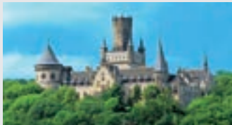
Schloss Marienburg, Pattensen

Eindrucksvoll erhebt sich Schloss Marienburg 20 Kilometer südlich von Hannover und 15 Kilometer nordwestlich von Hildesheim mit seiner unverwechselbaren Silhouette am Südwesthang des Marienberges.