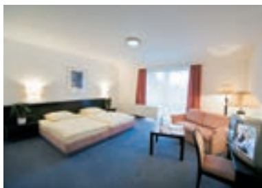
7 Balland's Hotel & Restaurant, Lindwedel

Gasthof Zum Eichenkrug ☆☆☆ ruhige Lage, 20 B, EZ € 45,- bis 55,-, DZ € 65,- bis 78,-, Mehrbett-Zi, inkl. Frühstück, alle Zi mit Du, WC, TV und WLAN, Bundeskegelbahn, ☎, P, Kaltenweiderstraße 36–38, Hotel@Eichenkrug-Wedemark.de, www.Hotel-Zum-Eichenkrug.de, ☎ +49 5130 2500 + 4445, Fax 36645.