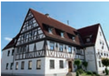
1 Hotel-Gasthof Rössle, Senden-Aufheim

10 D-87700 MEMMINGEN A 7 ab Kreuz Memmingen → A 96 Ausfahrt 13 Memmingen-Nord 500 m Allgäuhotel-Memmingen Nord ★★☆☆ 68 B, EZ € 72,-, DZ € 92,-, 3-Bett-Zi € 110,-, inkl. Frühstück, alle Zi mit Du, WC, TV und kostenfreiem Internet, Lift, Tagungsraum, Sauna, Dampfbad, großer P, auch für Busse, Teramost 31, @, www.allgaeuhotel-memmingen-nord.de, ☎+49 8331 991810, Fax 9918129.