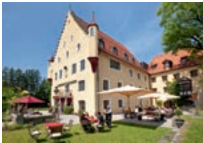
Schloss zu Hopferau, Hopferau