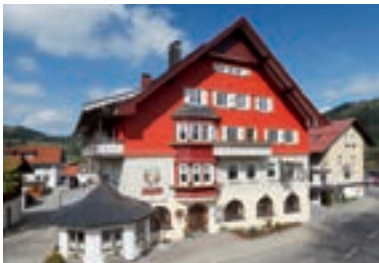
26 Brauerei & Gasthof Schäßlerbräu, Missen

Schloss zu Hopferau (☆☆☆☆) erbaut 1468, ruhig gelegen im Park, 27 B, EZ ab € 68,-, DZ ab € 64,- p.P., exkl. Frühstück, alle Zi mit Du, WC, LED-TV und kostenfreiem WLAN, Lift, zwei Restaurants, regionale und gehobene Küche, Tagungsräume, schöner Biergarten, Schlossgartencafé, P, Schloßstr. 9–11, @, www.schloss-hopferau.com, ☎ +49 8364 98489-0, Fax 98489-44 (Bild siehe Seite 143).