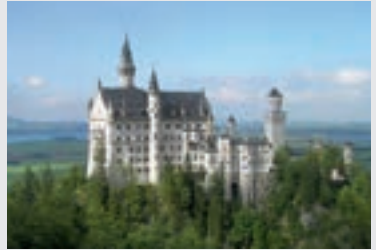
Schloss Neuschwanstein, Füssen

Am 5. September 1869 wurde der Grundstein für das Schloss bei Füssen gelegt. Ludwig II. erhoffte rasche Baufortschritte, doch dazu war das Projekt zu umfangreich und die Bedingungen auf dem Berg zu schwierig. Als Erstes wurde 1873 der Torbau fertiggestellt, in dem der Märchenkönig jahrelang wohnte. Erst 1880 fand das Richtfest statt, 1884 konnten die ersten Räume bezogen werden. Schloss Neuschwanstein wurde zur Zuflucht König Ludwig II. Das Schloss bei Füssen war sein letzter Aufenthaltsort, ehe man ihn nach Schloss Berg am Starnberger See brachte, wo er kurz darauf auf mysteriöse Weise ums Leben kam.