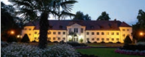
Orangerie im Hofgarten, Kempten

Kempten, das einstige römische Cambodunum und jetzt die größte Stadt im Allgäu blickt auf eine 2.000-jährige Geschichte zurück. Die Römerzeit wird lebendig im Archäologischen Park Cambodunum. Das Stadtbild ist geprägt durch das jahrhundertlange Nebeneinander der ehemalige Reichsstadt und der Fürststabe Kempten. Das Allgäu-Museum im Kornhaus, eine Führung durch die Prunkräume der Residenz, eine Multivisionsshow in der unterirdischen Erasmuskapelle am St. Mang-Platz, ein Spaziergang durch die historische Altstadt. Mit einem ausgedehnten Einkaufsbereich vom Hildegard- und Residenzplatz sowie dem Mühlbachquartier im Norden bis zum Forum Allgäu im Süden macht Einkaufen in Kempten Spaß. Oder einfach Menschen in den Straßencafés oder auf dem Wochenmarkt begegnen oder im Hofgarten die Ruhe genießen.