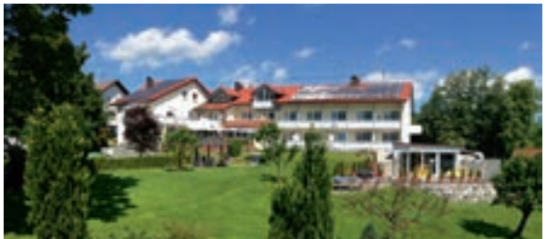
27 Sporthotel am Sonnenhang, Oy-Mittelberg