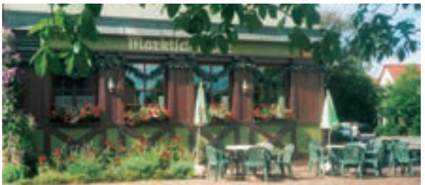
8 Gaststätte Marktschmiede, Erolzheim