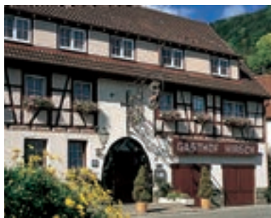
Gasthof Hirsch, Bad Ditzenbach-Gosbach