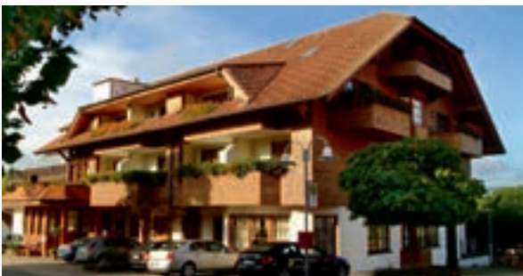
6 Hotel-Restaurant-Vinothek Lamm, Bad Herrenalb-Rotensol

Lassen Sie Ihren Gastgeber wissen, dass Sie gerne mit Links+Rechts der Autobahn reisen.