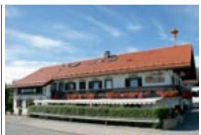
4 Hotel-Restaurant Kramerwirt, Irschenberg