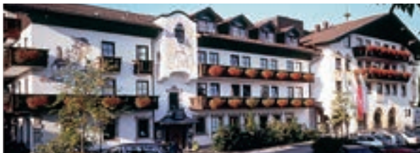
13 Hotel Zur Post, Rohrdorf