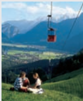
Panoramablick von der Loferer Alm

Das Salzburger Saalachtal mit den vier Orten Lofer, St. Martin, Unken und Weißbach liegt zentral im Dreiländereck Salzburg, Tirol und Bayern. Genießen Sie die herrliche Aussicht über Berg und Tal, begeben Sie sich auf spannende Touren mit dem Mountainbike. Nutzen Sie im Winter die beiden Skigebiete. Ein Besuch der Vorderkaserklamm, eine Wanderung durch die Lamprechtshöhle oder der Seisenbergklamm sind nur einige von vielen Ausflugsmöglichkeiten. Die Loferer Alm mit imposantem Panorama ist zu jeder Jahreszeit einen Ausflug wert.