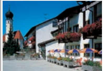
10 Hotel Ariadne, Rosenheim