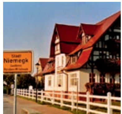
5 Hotel-Gasthaus „Zum Alten Ponyhof“, Niemeck