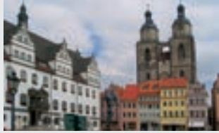
Marktplatz mit Rathaus und Stadtkirche St. Marien

Erleben Sie ein Stück Weltgeschichte und begegnen Sie auf Ihrer Erkundungstour dem berühmten Reformator Dr. Martin Luther und seinen Zeitgenossen, deren Spuren bis heute in der Wittenberger Altstadt nachvollziehbar sind. Neben den zum UNESCO-Welterbe gehörenden Luthergedenkstätten gibt es aber noch mehr zu entdecken. Überzeugen Sie sich selbst vom kontrastreichen Angebot, das diese Stadt für Sie bereithält!