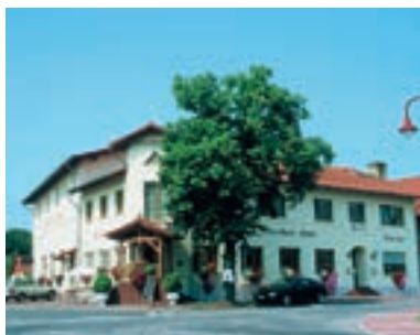
4 Hotel-Restaurant Linthor Hof, Linthe

A 9 ab Ausfahrt 17 Leipzig-West 200 m Hotel Restaurant Leipzig West ☆☆☆ 97 B, EZ € 46,- bis 51,-, DZ € 65,- bis 72,-, Mehrbett-/Familien-Zi, inkl. Frühstücksbuffet, alle Zi mit Du, WC, ☎, Kabel-TV, Schreibisch, WLAN und Pay-TV, Bar, Raucherraum, Tagungen mit Technik, Rezeption 24 h, Sommerterrasse, ♿, ♿, ♿, großer P, Westring Straße 83, @, www.hotel-leipzigwest.de, ☎ +49 34205 62-0, Fax 62-222.