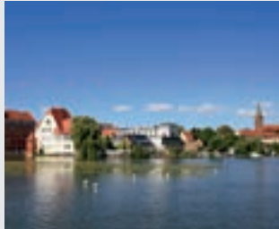
Blick auf den Dom, Brandenburg

69 Meter misst der Marienberg, die höchste Erhebung der Havelstadt. Doch der Aufstieg vorbei an der Muschelgrotte und dem neuen Rosenhag hoch zur Friedenswarte lohnt sich. Von hier oben genießen Sie einen unvergleichlichen Rundblick über die Havelstadt und das Land. Erklimmen Sie den Marienberg und lassen Sie sich von der wunderschönen Aussicht verzaubern.