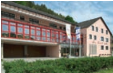
22 Hotel Heckl Gasthof „Zum Schinkenkönig“, Kinding-Enkering

A 9 ab Ausfahrt 56 Hilpoltstein 4 km (Weinsfeld, Offenbau) und Ausfahrt 57 Greding 12 km Gasthof Zur Linde ☆☆☆ 9 B, EZ € 32,-, DZ € 46,-, inkl. Frühstück, alle Zi mit Du, WC und TV, gute Küche, Gerichte € 6,- bis 12,-, eigene Hausschlachtung, Räume 35-120 Personen, Terrasse, ☎, großer P, Haus Nr. 29, @, ☎ +49 9173 406.