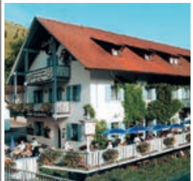
23 Landgasthof Zum alten Wirt am Schellenberg, Kinding-Enkering

Hotel-Gasthof Krone ☆☆☆ ruhige Lage, 50 B, EZ ab € 49,-, DZ ab € 72,-, inkl. Frühstücksbuffet, alle Zi mit Du, WC, Fön, ☎, TV und kostenlosem WLAN, Gerichte von € 5,- bis 23,50, gemütliche Stüberl von 30–100 Personen, Biergarten, eigene Wurst- und Teigwaren, ☎, Bus-P, Marktplatz 14, info@krone-kinding.de, www.krone-kinding.de, ☎ +49 8467 80103-0, Fax 80103-33.