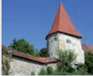
Gassell, Greding

Greding, die „Stadt der 21 Türme“, gelegen im malerischen Schwarzachtal, kann stolz auf eine mehr als 900-jährige Geschichte zurückblicken. Der Ortsname mit der Endung -ing und das Patrozinium der Martinsbasilika deuten darauf hin, dass hier wohl bereits im 8. Jahrhundert n. Chr. eine bajuwarisch geprägte Siedlung entstand. Die erste urkundliche Erwähnung Gredings erfolgte im Jahr 1091 in einer Urkunde Kaiser Heinrichs IV., der den Ort den Bischöfen zu Eichstätt übergab. Handel und Gastronomie sind auf die unterschiedlichsten, individuellsten Ansprüche eingestellt.