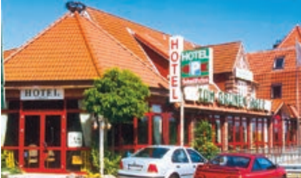
3 Hotel Gremersdorf – Zum grünen Jäger, Gremersdorf