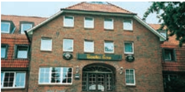
18 Gasthof Braaker Krug, Braak/Hamburg