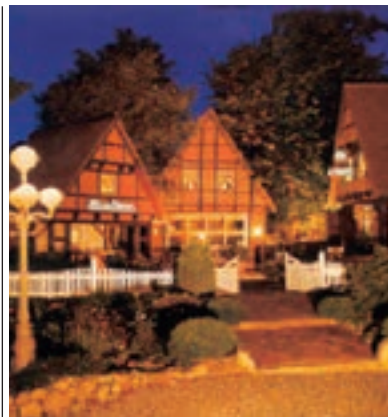
2 Hotel Alter Krug, Großenbrode