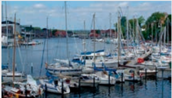
Hafen, Neustadt in Holstein

Der natürlich gewachsene, fjordähnliche Hafen mit Traditionsseglern, Fischerbooten, hin und wieder auch Frachtern, lädt zum Staunen ein. Tagsüber Fischbrötchen, abends ein leckeres Selbstgebrantes mit Blick auf die Schiffe und das postkartenverdächtige Binnenwasser, so lässt es sich verweilen.