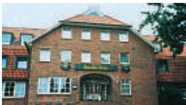
12 Gasthof Braaker Krug, Braak/Hamburg

Cordes Akzent Hotel und Restaurant ★★★ 70 B, EZ € 56,- bis 88,-, DZ € 81,- bis 108,-, inkl. Frühstücksbuffet, alle Zi mit Du, WC, ☎, Flat-/Kabel-TV und WLAN, Restaurant, Biergarten, Tesla Ladestation, E-Ladestation, ☎, ☎, ☎, Sottorfer Dorfstr. 2, hotel@hotel-cordes.de, www.hotel-cordes.de, ☎ +49 4108 4344-0, Fax 4344-22.