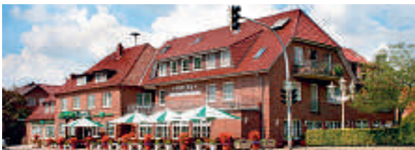
3 Hotel Böttchers Gasthaus, Rosengarten-Neenndorf

Shell-Tankstelle ⛽ Shop, Waschanlage, Toilette, Geldautomat, ☎, Öffnungszeiten: Mo-Fr 5-21 Uhr, Sa 7-21 Uhr, So 8-21 Uhr, Hoheluft 1, www.shell.de, ☎ +49 4181 921127.