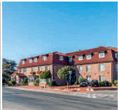
15 Hotel-Restaurant Hilker, Bersenbrück