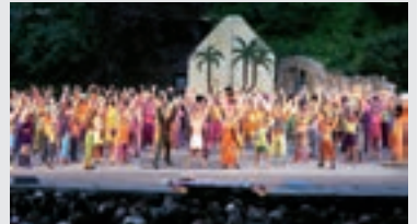
Die Freilichtbühne, Tecklenburg

Mit mehr als 2.300 Sitzplätzen ist die Tecklenburger Bühne das größte Freilicht-Musiktheater Deutschlands. Über 100.000 Besucher erleben pro Jahr das Besondere an den Freilichtspielen Tecklenburg: ein einmaliges Zusammenspiel von Natur, Atmosphäre, Unterhaltung und Kunst. Für die Musical-Produktionen in Tecklenburg wird das gesamte Areal miteinbezogen: Große Bühnenbilder mit teilweise über 100 Solisten und Chormitgliedern erzeugen eine Wirkung, als wäre man mittendrin im Geschehen. Die Zuschauer auf den mehr als 2.300 Sitzplätzen, von denen 1.800 überdacht sind, lassen sich faszinieren von der Dimension dieser Bilder und der Kraft der Musik, die traditionell von einem Liveorchester gespielt wird. Beliebte, namhafte Stars der internationalen Theater- und Bühnenszene werden jedes Jahr aufs Neue für die Tecklenburger Musical-Highlights verpflichtet.