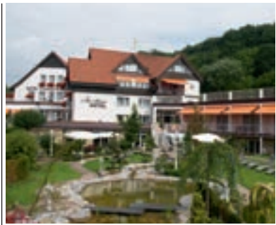
6 Ringhotel Teutoburger Wald, Tecklenburg-Brochterbeck