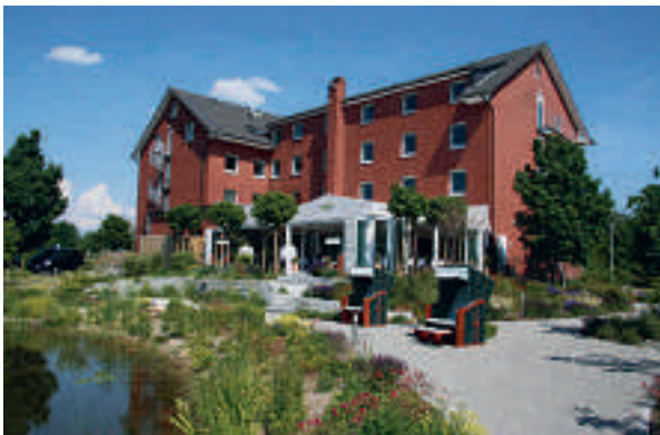
7 Hotel & Restaurant Fricke, Lehrte-Hämelerwald

Hotel Am Försterberg (☆☆☆) 36 B, EZ ab € 49,-, DZ ab € 89,-, 3-Bett-Zi ab € 109,-, inkl. Frühstücksbuffet, alle Zi mit Du, WC, ☎, TV und Internet, Räume bis 130 Personen, frische, regionale Küche, Mittagstisch, ☎, P, Mo./., Immenser Straße 10, @, www.hotel-am-foersterberg.de, ☎ +49 5136 88080, Fax 873342.