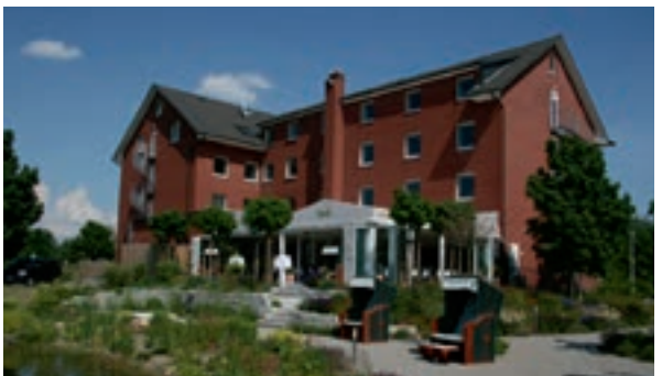
8 Hotel & Restaurant Fricke, Lehrte-Hämelerwald

A 2 ab Ausfahrt 52 Peine 9 km → Ilsede, in Ilsede links → Oberg 2 km, A 391 Ausfahrt 5 Braunschweig-Lehndorf B 1 → Hildesheim, dann B 444 Hotel garni Graf Von Oberg ☆☆☆ historische Wasserburg in englischem Landschaftspark, EZ € 55,- bis 82,-, DZ € 75,- bis 92,-, inkl. Frühstück, alle Zi mit Bad/Du, WC und TV auf Anfrage, Seminarraum, historischer Burgkeller, ☎ auf Anfrage, P im Hof, Oststraße 30, ☎ +49 5172 3307, Fax 3170.