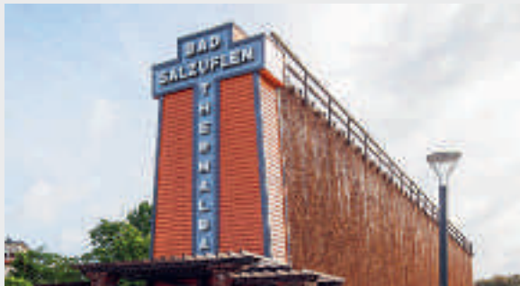
Gradierwerk Bad Salzufflen

Das nordrhein-westfälische Heilbad Bad Salzufflen hat im Jahr 2018 einen neuen Erlebnis- und Gesundheitspark eröffnet. Der mit einem Blütenmeer, einer modernen Kneipp-Insel und Sole-Strand wiedereröffnete, barrierefreie Kurpark vermittelt Wissenswertes und regt zum Mitmachen an. 35.000 Pflanzen wurden eingesetzt, 3,5 Millionen Euro für den Kurpark einschließlich der Kneipp-Insel investiert. Zahlreiche Brunnen und heilsame Solequellen haben die 55.000-Einwohner-Stadt zu einer zertifizierten Frischluftoase für Allergiker gemacht. Die Kurparklandschaft vereint künftig drei Elemente: Ruhe und Entspannung finden die Besucher in Bereichen im Stil eines klassischen Kurparks. Highlights des Erlebnisraums sind der Kneipp-Parcours und der Sole-Strand. Infotainment findet in der neu gestalteten Konzertmuschel sowie zukünftig in der Wandelhalle statt. Neben dem neuen Kurpark sind die Gradierwerke ein weiteres gesundheitstouristisches Wahrzeichen der Stadt: Mit ihrer mikrofeinen Frischluftoase schaffen sie in der Innenstadt eine stark allergenreduzierte Zone. 600.000 Liter Sole rieseln täglich über die großen Schwarzdornwände und sorgen im Herzen der Stadt für ein Klima wie an der See.