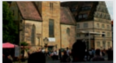
Kirche St. Nicolai und das Hochzeitshaus

Vor über 725 Jahren tauchte der Sage der Brüder Grimm nach ein Fremder in Hameln auf, der die Stadt in der ganzen Welt berühmt gemacht hat. Selbst in Amerika und Asien kennt man den Rattenfänger, der mit der unheimlichen Kraft seiner Musik Hameln erst von der Rattenplage befreite, dafür nicht den versprochenen Lohn erhielt und schließlich aller Kinder auf Nimmerwiedersehen aus der Stadt lockte.