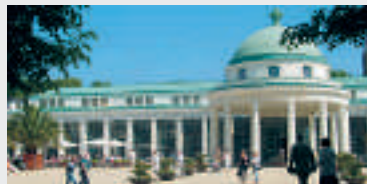
Wandelhalle und Quelle „Hyllige Born“

Imitten der malerischen Hügellandschaft des Weserberglandes liegt Bad Pyrmont, das größte Staatsbad Niedersachsens. Das milde Schonklima, die besondere Naturheilquelle sowie die Naturkohlenensäure und das ortsspezifische Naturmoor verwöhnen ruhe- und erholungssuchende Gäste mit ihren heilenden und wohltuenden Eigenschaften. Überregional bekannt ist die Stadt auch für ihren Palmengarten im Kurpark, der größten Palmenfrianlage nördlich der Alpen. Eine zentrale Einrichtung des Staatsbades ist das ambulante Therapie- und Rehabilitationszentrum Königin-Luise-Bad, in dem alle ambulanten Kurorttherapien angeboten werden.