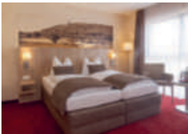
9 Hotel Weserschiffchen, Porta Westfalica-Holtrup

Hotel Hansa ☆☆☆ ruhige Lage direkt im Zentrum, 60 B, EZ € 67,- bis 115,-, DZ € 99,- bis 139,-, inkl. Frühstück, alle Zi mit Du, WC, Fön, ☺, TV und kostenfreiem WLAN, Lift, ☎, kostenfreier P im Parkhaus, Brüderstraße 40, @, www.hotel-hansa-herford.de, ☎ +49 5221 5972-0, Fax 5972-59.