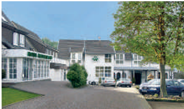
14 Hotel-Restaurant Waldesrand, Herford

Das nordrhein-westfälische Heilbad Bad Salzufflen hat im Jahr 2018 einen neuen Erlebnis- und Gesundheitspark eröffnet. Der mit einem Blütenmeer, einer modernen Kneipp-Insel und Sole-Strand wiedereröffnete, barrierefreie Kurpark vermittelt Wissenswertes und regt zum Mitmachen an. 35.000 Pflanzen wurden eingesetzt, 3,5 Millionen Euro für den Kurpark einschließlich der Kneipp-Insel investiert. Zahlreiche Brunnen und heilsame Solequellen haben die 55.000-Einwohner-Stadt zu einer zertifizierten Frischluftoase für Allergiker gemacht. Die Kurparklandschaft vereint künftig drei Elemente: Ruhe und Entspannung finden die Besucher in Bereichen im Stil eines klassischen Kurparks. Highlights des Erlebnisraums sind der Kneipp-Parcours und der Sole-Strand. Infotainment findet in der neu gestalteten Konzertmuschel sowie zukünftig in der Wandelhalle statt. Neben dem neuen Kurpark sind die Gradierwerke ein weiteres gesundheitstouristisches Wahrzeichen der Stadt: Mit ihrer mikrofeinen Frischluftoase schaffen sie in der Innenstadt eine stark allergenreduzierte Zone. 600.000 Liter Sole rieseln täglich über die großen Schwarzdornwände und sorgen im Herzen der Stadt für ein Klima wie an der See.