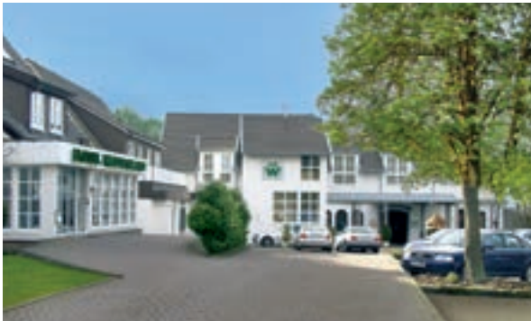
17 Hotel-Restaurant Waldesrand, Herford

Auch heute noch streift er durch die Hamelner Gassen. Sie können ihn buchen für eine einzigartige Erlebnisführung oder die Begrüßung Ihrer Gruppe.