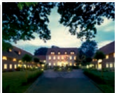
11 Landhotel Gut Meier Gresshoff, Oelde