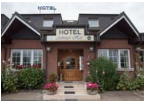
8 Hotel-Restaurant Asberger Hof, Moers

8 D-47441 MOERS A 40 ab Ausfahrt 10 auf die Autostraße, nächste Abfahrt → Kerken, dann 100 m hinter der Ampel rechts oder ab ABK Moers → Duisburg 2 km Hotel Asberger Hof ☆☆☆ 44 B, EZ € 48,- bis 55,-, DZ € 63,- bis 75,-, Aufbettung zzgl. € 20,-, inkl. Frühstücksbuffet, alle Zi mit Du, WC, ☎, TV und WLAN, einige Restaurants in wenigen Minuten Fußweg zu erreichen, ☎, P, Asberger Str. 199, @, www.hotel-asbergerhof.de, ☎ +49 2841 51170, Fax 55155.