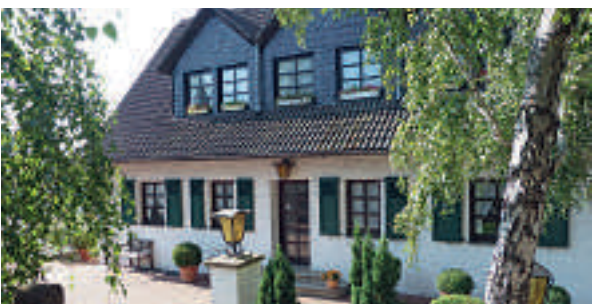
15 Mühlheim an der Ruhr, Hotel-Restaurant Landhaus Sassenhof

10 D-47665 SONSBECK A 57 ab Ausfahrt 4 Uedem → Kerwenheim/Flughafen, nach 700 m links → Sonsbeck 1,5 km Bossenhof Ferienwohnung & Gästezimmer (☆☆) 8 B, EZ ab € 32,-, DZ ab € 56,-, inkl. Frühstück, alle Zi mit Du, WC, TV und WLAN, Flughafen 11 km, 🍷, P, Balberger Str. 153, @, www.bossenhof.de, ☎ +49 2838 3834, Fax 96638.