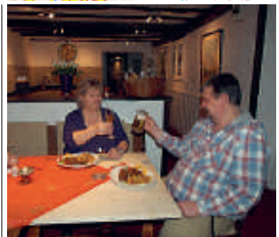
18 Hotel & Restaurant Decker, Düsseldorf