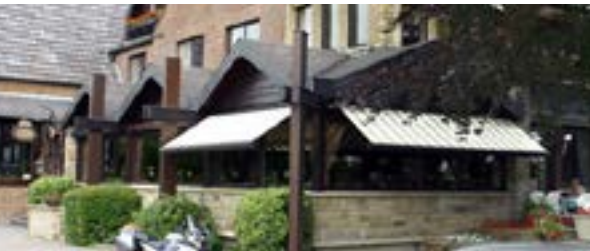
1 Insel-Gasthof, Rees-Grietherort

11 D-47665 SONSBECK A 57 ab Ausfahrt 4 Uedem → Kervenheim/Flughafen, nach 700 m links → Sonsbeck 1,5 km Bossenhof Ferienwohnung & Gästezimmer ☆☆☆ 8 B, EZ ab € 30,-, DZ ab € 52,-, inkl. Frühstück, alle Zi mit Du, WC und TV, Flughafen 11 km, (E), P, Balberger Str. 153, @. www.bossenhof.de, ☎ +49 2838 3834, Fax 96638.