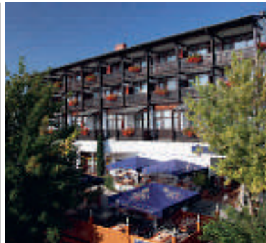
18 AktiVital Hotel, Bad Griesbach