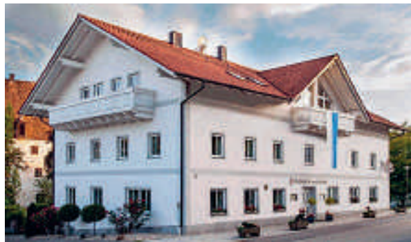
14 Hotel Wirtshaus am Schloss, Aicha vorm Wald