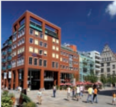
Jakobikirchplatz, Chemnitz

Wohl auf keine andere Stadt in Deutschland trifft die Bezeichnung „Stadt der Moderne“ so zu wie auf Chemnitz. Erblüht zur Zeit der industriellen Moderne, die nach wie vor Impulse gibt für die dynamische Entwicklung von Wirtschaft und Wissenschaft in Deutschland, steht Chemnitz gleichzeitig für die Einflüsse der kulturellen und architektonischen Moderne. Von den Erfolgen der Chem-