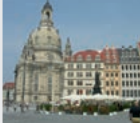
Frauenkirche, © Christoph Münch/ Dresden Marketing GmbH

Die Dresdner Altstadt wurde im zweiten Weltkrieg sehr stark zerstört. Ein Symbol für den Wiederaufbau der Stadt an der Elbe ist die Dresdner Frauenkirche, die erst im Jahre 2005 wieder komplett fertig gestellt wurde und seitdem sehr viele Besucher anzieht.