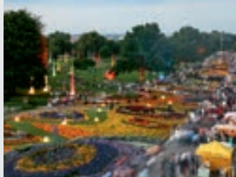
Lichterfest im egapark

Der egapark Erfurt ist das bedeutendste Gartendenkmal der 1960er Jahre in Deutschland und gehört zu den wichtigsten Zeugnissen der Gartenarchitektur dieser Zeit. Zu den Anziehungspunkten des egaparks Erfurt gehören unter anderem das größte ornamental bepflanzte Blumenbeet Europas, der Rosengarten, der Japanische Fels- und Wassergarten, die Gräser- und Staudengärten, die tropischen Pflanzenschauhäuser mit dem Schmetterlingshaus, der größte Spielplatz Thüringens mit Kinderbauernhof und Wasserareal, der Skulpturengarten mit Plastiken namhafter Künstler und die historische Cyriaksburg mit dem Deutschen Gartenbaumuseum.