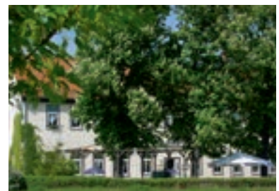
12 Gasthaus Fürstenhof, Erfurt-Frienstedt