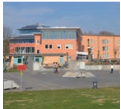
13 JUFA, Jülich