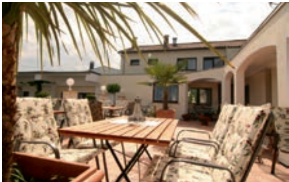
4 Landhotel-Restaurant „Bergischer Hof“, Overath-Marialinden