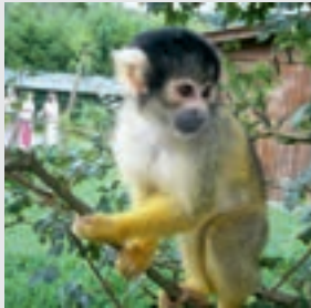
Affen- und Vogelpark, Reichshof

Ideal für Gruppenreisen und einen Tagesausflug. Eingebettet in sanft geschwungene Hügel liegt der Heilklimatische Kurort Eckenhagen. Hier erlebt man die Welt der Vorfahren um die Jahrhundertente im Bauernhofmuseum „D'r Isenhardt's Hoff“. Im „Haus des Gastes“ zeigen die Mineraliengrotte die 800-jährige Bergwerkstradition und seltene Mineralien sowie das Trachtenpuppenmuseum ca. 800 Exponate aus aller Welt.