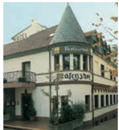
7 Altstadthotel Präsenzhof, Bensheim