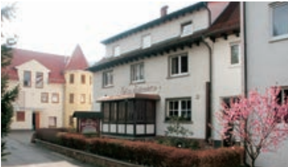
9 Gasthof und Pension Zum Kaiserwirt, Heppenheim-Oberlaudenbach