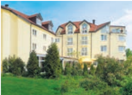
5 Hotel-Restaurant Felix, Bensheim

8 D-64625 BENSHEIM A 5 ab Ausfahrt 30 Bensheim ca. 900 m Aral Autohof Bensheim ☎ Shop, Bistro, Geldautomat, ☎, Truckerkarten u. Tankkarten, Ampèrestraße 1, ☎ +49 6251 58173-4, Fax 58173-6.