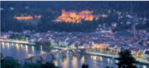
Blick auf das Heidelberger Schloss

Auf dem Gebiet einer mittelalterlichen Burganlage, deren Alter und frühe Geschichte nicht bekannt sind, erhebt sich heute hoch über den engen Gassen und dem malerischen Dächergewirr der Altstadt majestätisch die Ruine des Heidelberger Schlosses. Fünf Jahrhunderte lang haben dort die Kurfürsten von der Pfalz aus dem Geschlecht der Wittelsbacher residiert. Das Schloss Heidelberg entstand in einer Bauzeit von über dreihundert Jahren. Seine Bauten folgen nicht einem einheitlichem Stil. Noch heute finden sich in dem Komplex architektonische Zeugnisse vor allem der Gotik und der Renaissance.