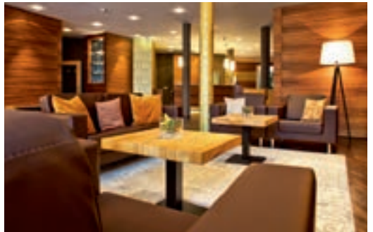
6 Hotel Bacchus, Bensheim