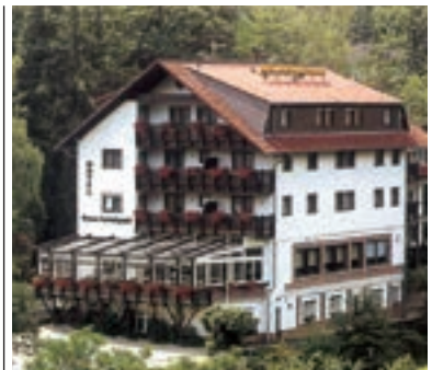
12 Hotel Neues Ludwigstal, Schriesheim