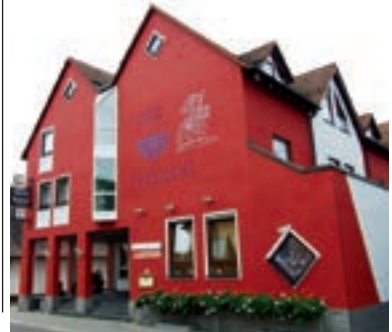
9 Rheinst-Restaurant Ritter, Büchenau