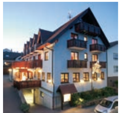
14 Hotel „La Cigogne“, Waldbronn-Busenbach