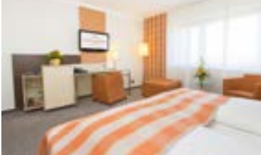
8 Hotel Scheffelhöhe, Bruchsal

Gästehaus Karlshof ☆☆ 500 m von Karlshof gelegen, 80 B, EZ € 59,- bis 79,-, DZ € 85,- bis 105,-, inkl. Frühstück, Zusatzbetten € 15,-, alle Zi mit Du, WC, ☎ und TV, Lift, P, Lu3hardtstr. 5, www.hotelkarlshof.com, ☎ +49 7251 447-0, Fax 447-96.