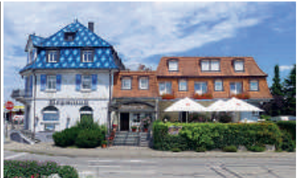
4 Hotel Batzenberger Hof, Bad Krozingen