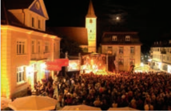
Cover Nights auf dem Markgräfler Platz

Das Markgräfler Museum Müllheim ist ein lebendiges, offenes Haus. Es hat sich zum wichtigsten Regionalmuseum zwischen Freiburg, Mulhouse und der Agglomeration Basel/Lörrach entwickelt. Seit 1979 ist das Museum in einem frühklassizistischen, dreiflügeligen Stadtpalais direkt am historischen Marktplatz untergebracht.