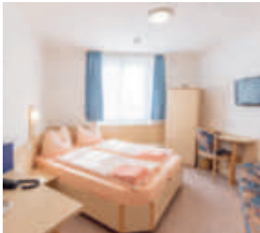
5 Hotel-Restaurant „Fallerhof“ und Gästehaus, Bad Krozingen-Hausen