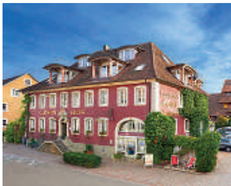
11 Landhotel Krone, Hotel-Restaurant-Kronenkeller, Heitersheim