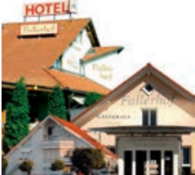
4 Hotel-Restaurant „Fallerhof“ und Gästehaus, Bad Krozingen-Hausen

Lassen Sie Ihren Gastgeber wissen, dass Sie gerne mit Links+Rechts der Autobahn reisen.