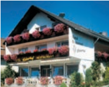
18 Hotel-Restaurant Kaiserhof, Bad Bellingen