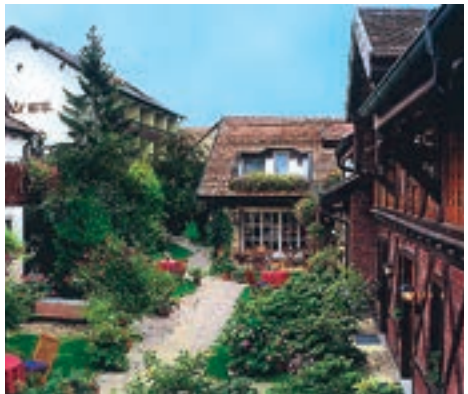
13 Hotel zur Krone, Auggen