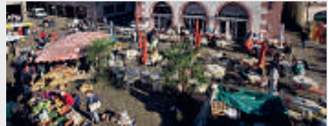
Freiburg Münsterplatz

Die Freiburger haben ihre Sehenswürdigkeiten sehr gut organisiert: im Leitsystem findet man die Standorte der Freiburger Attraktionen. An zentralen Punkten der Innenstadt befinden sich insgesamt 15 Stellen mit Informationen zu den Sehenswürdigkeiten und einem Stadtplan. Besonders in der historischen Altstadt reiht sich ein Touristenmagnet an den nächsten. Jeden Besucher Freiburgs zieht es sofort zum Münster, den die Stadt mit seinen 116 Metern überragt. Das Freiburger Münster liegt in direkter Nachbarschaft zum Erzbischöflichen Palais – errichtet im Jahr 1756 für die Breisgauer Ritterschaft –, dem Historischen Kaufhaus aus dem 16. Jahrhundert und dem Wentzingerhaus Museum für Stadtgeschichte auf dem Münsterplatz. Auf dem Platz gibt es täglich von 9 bis 12 Uhr frische Lebensmittel aus der Region, lebendige Atmosphäre und natürlich die weltberühmte Münsterwurst, jetzt auch als Tofu-Version! Einen gemütlichen Ausklang findet die Städtetur bei einem Glas badischen Weines, zum Beispiel in der Alten Wache – einer Sehenswürdigkeit, die sich ebenfalls auf dem Münsterplatz befindet. Die ehemalige Hauptwache der österreichischen Wachgarison wurde von Zimmermeister Johann Martin Vonderlew 1733 errichtet. Festliche Stimmung herrscht in Freiburg zur Adventszeit auf dem Rathausplatz, dem Kartoffelmarkt, in Unterlinden, der Franziskanerstraße und der Turmstraße wenn der Weihnachtsmarkt zu Glühwein und Geschenke-Kauf einlädt.