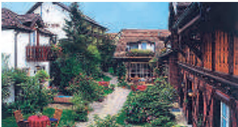
14 Hotel zur Krone, Auggen

25 D-79597 SCHALLBACH A 5 ab ABD Weil → Lörrach (A 98), Ausfahrt 4 Kandern 3 km → Rümningen, Ortsmitte links → Schallbach Hotel Garni Alte Post (☆☆) familiär geführtes Haus, ruhige Lage kurz vor der Schweizer Grenze, 5 EZ ab € 66,-, 11 DZ ab € 96,-, inkl. Frühstück (Preise bei Messe nicht gültig), alle Zi mit Du, WC, ☎, TV und WLAN, teils Balkon, 15 Autominuten zur Messe und Innenstadt von Basel, Restaurants befinden sich in näherer Umgebung, P, Alte Poststr. 19, info@gasthof-altepost.de, www.gasthof-altepost.de, ☎ +49 7621 940949-0, Fax 940949-33.