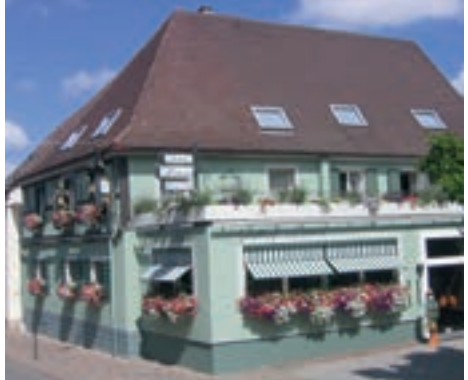
10 Gasthof Löwen mit Gästehaus, Heitersheim