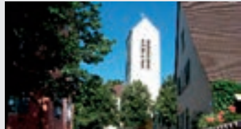
Neuenburger Kirche, Neuenburg

Die Zähringerstadt direkt an der A 5 Karlsruhe-Basel, Anschluss-Stelle 65, am Autobahndreieck Deutschland/Frankreich/Schweiz, bietet Ihnen sehr gute Übernachtungsmöglichkeiten, Campingplätze, badische Küche und ein grenzüberschreitendes Radwegenetz. Tankstellen am Ort. Wählen Sie Neuenburg am Rhein als Ausgangspunkt für Entdeckungsfahrten nach Freiburg, Colmar, Mulhouse und Basel. Das Museum für Stadtgeschichte ist ein Muss für alle, die sich mit der Stadtgeschichte auseinandersetzen wollen. Der historische Stadtrundgang, die verschiedenen Kreuzwege und die Heilig-Kreuz-Kapelle gehören ebenfalls dazu.