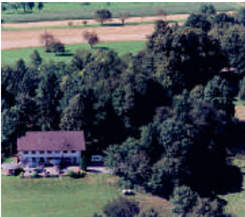
21 Hotel-Restaurant Hohe Flum, Schopfheim-Wiechs

Auch wenn Breisach im Zweiten Weltkrieg fast vollständig zerstört wurde, kann man heute noch zahlreiche, zum Teil wiederaufgebaute Sehenswürdigkeiten aus der reichen Vergangenheit der heutigen Europastadt finden. Neben dem Wahrzeichen der Stadt, dem St. Stephansmünster mit seinen berühmten Kunstschatzen, sind dies der Radbrunnen in der Mitte der Oberstadt, die noch vorhandenen alten Stadttore, das prächtige barocke Rheintor – heute Museum für Stadtgeschichte am Schwanenweiher –, das mittelalterliche Kapftor am Ende der Goldengasse, der Hagenbachturm auf der Münsterbergstraße, das Kupfertor am gleichnamigen Platz sowie die St. Josefskirche mit dem ehemaligen Schwedenturm in der Unterstadt. Das „Blaue Haus“, das ehemalige jüdische Gemeindehaus, in der Rheintorstraße (ehemals Judengasse) bewahrt als kleines Museum und Begegnungs- und Veranstaltungsraum die Erinnerung an die einstige Jüdische Gemeinde. In den Stadtteilen laden die jeweiligen, z. T. baugeschichtlich bis in die Romanik zurückreichenden Kirchen zu einer Besichtigung ein.