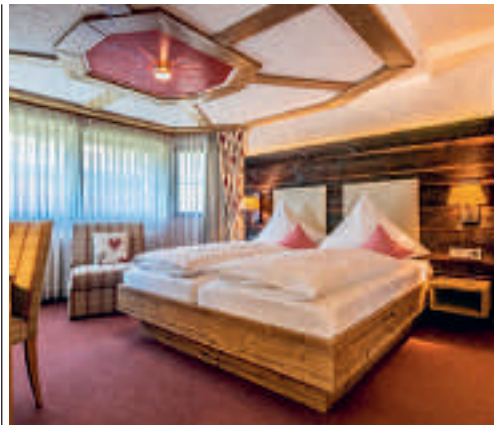
22 Hotel Restaurant Krone, Schopfheim-Wiechs