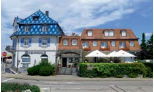
3 Hotel Batzenberger Hof, Bad Krozingen