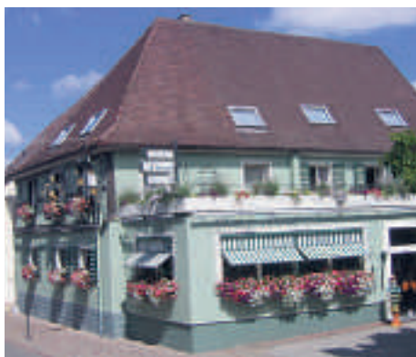
12 Gasthof Löwen mit Gästehaus, Heitersheim