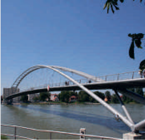
Weil am Rhein

Im äußersten Südwesten Deutschlands, liegt Weil am Rhein. Hier kommen Architektur- und Kulturliebhaber genauso auf ihre Kosten wie Sportler oder Aktivreisende. Bereits mehr als 20 Geschäfte, Gasthäuser und Gewerbebetriebe bekennen sich zur „Stadt der Stühle“. Dies findet Ausdruck in den – im Maßstab 1,5:1 bis 8:1 vergrößerten – Designer-Stühlen, die zahlreiche Dächer und Plätze der Stadt zieren. Die Dreiländerbrücke zwischen Weil am Rhein und Huningue in Frankreich ist die weltweit längste freitragende Brücke. Ausgezeichnet wurde sie unter anderem mit dem Deutschen Brückenbaupreis 2008, der Arthur G. Hayden Medaille sowie dem weltweit renommiertesten Ingenieurpreis der International Association for Bridge and Structural Engineering, dem Outstanding Structure Award. Gruppenführungen gibt es auf Anfrage. Für Weinliebhaber bietet sich Weil am Rhein und seine Umgebung besonders an: Der Weinweg in Weil am Rhein, Lörrach, Tüllingen und Riehen lädt dazu ein, die Landschaft im Herzen des Markgräflerlands, der „Toskana Deutschlands“, kennen zu lernen.