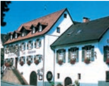
19 Landgasthof Hotel Schwanen, Bad Bellingen