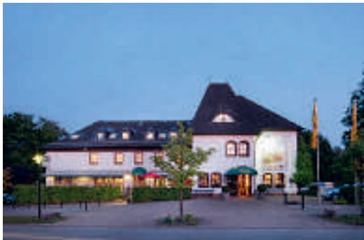
1 Landidyll Landhotel Saarschleife, Mettlach

2 D-66763 DILLINGEN A 8 ab Ausfahrt 10 Dillingen-Süd ca. 2 km → City Hotel Meilchen ★★ Citylage, 29 B, EZ € 53,- bis 58,-, DZ € 76,- bis 85,-, inkl. Frühstücksbuffet, alle Zi mit Du, WC, ☎ und TV, Lift, Ecke Hüttenwerkstraße 31, Hoteleingang Kieferstr., info@hotel-meilchen.de, www.hotel-meilchen.de, ☎+49 6831 90982-00, Fax 90982-50.