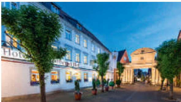
12 Hotel Württemberger Hof, Öhringen