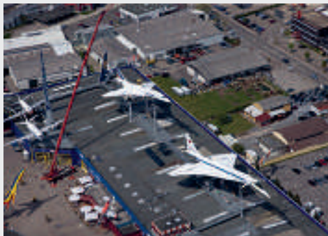
Auto & Technik Museum, Sinsheim