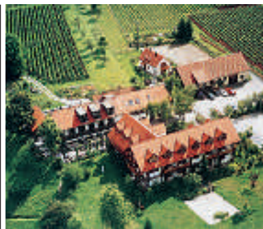
9 Hotel und Gutsgaststätte Rappenhof, Weinsberg