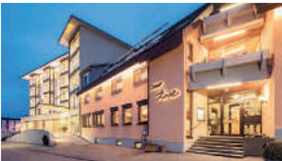
11 Hotel Rose, Bretzfeld

A 81 ab Ausfahrt 10 Weinsberg-Ellhofen ca. 1 km, siehe Hinweisschilder Hotel und Gutsgaststätte Rappenhof ☆☆☆ ruhige Aussichtslage, 59 B, EZ ab € 109,-, DZ ab € 129,-, Suite € 149,-, inkl. Frühstücksbuffet und WLAN, Zi mit Du, WC, ☎ und Balkon, Bio-zertifiziertes Restaurant mit Wintergarten bis 100 Personen, Räume für Tagungen bis 40 Personen, Gartenterrasse, Spielplatz, Kutschfahrten, ☎, P, Rappenhofweg 1, @, www.rappenhof.de, ☎ +49 7134 519-0, Fax 519-55 (siehe auch Seite 239).