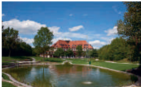
15 Flair Park-Hotel Illshofen, Illshofen

23 D-91637 WÖRNITZ A 7 ab Ausfahrt 109 Wörnitz ca. 1 km und A 6 ab Ausfahrt 49 Feuchtwangen ca. 6 km Autohof Wörnitz Restaurant mit einer vielfältigen Auswahl an regionalen Speisen in familiärer Atmosphäre, rund 320 Sitzplätze im Gastraum, geeignet für Familienfeiern, Terrasse, Burger King, Sanitäranlagen mit Duschen sowie Waschmaschine und Trockner, WLAN (60 Minuten kostenfrei), Seminarraum u.v.m., Tankstelle (Shell) mit großzügigem Shop und breit gefächertem Sortiment, rund 100 Pkw- und 180 Lkw-Parkplätze (Sicherheitsparkplätze für Lkws) sowie Übernachtungsmöglichkeit für Caravan und Wohnmobil, 24 h geöffnet, Bastenauer Str. 10–12, @, www.autohof-woernitz.de, +49 9868 98940, Fax 6782.