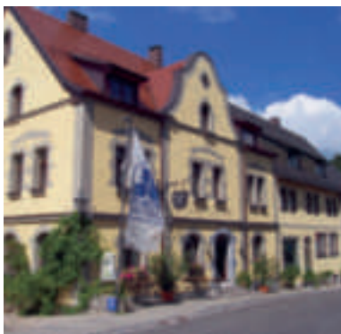
15 Flair-Hotel „Die Post“, Schillingsfürst