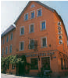
Hotel Bayerischer Hof, Kitzingen