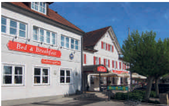
10 Bed & Breakfast Gallmersgarten, Gallmersgarten

A 7 ab Ausfahrt 111 Feuchtwangen-West und A 6 ab Ausfahrt 49 Feuchtwangen-Nord je 4 km Gasthaus Sindel-Buckel mit Karpfenhotel 34 B, EZ € 53,- bis 66,-, DZ € 73,- bis 86,-, inkl. Frühstücksbuffet, alle Zi mit Bad/Du, WC, TV und Internet, sehr gute, regionale Küche mit Fisch, Wild, Geflügel, Lamm, vegetarisch, großer Biergarten, Wintergarten, Räume für 40 bis 120 Personen, P, Spitalstr. 28, info@sindel-buckel.de, www.sindel-buckel.de, ☎ +49 9852 2594, Fax 3462.