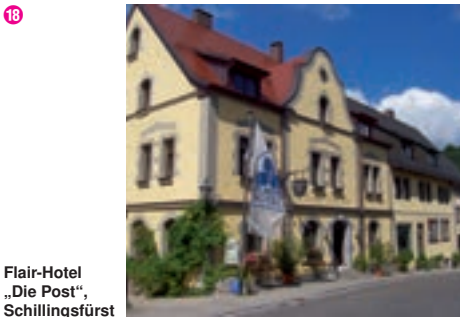
18 Flair-Hotel „Die Post“, Schillingsfürst