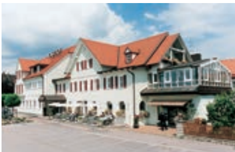
12 Landgasthof Sämman, Steinach

Gasthaus Sindel-Buckel mit Karpfenhotel ☆☆☆ 34 B, EZ € 49,- bis 65,-, DZ € 69,- bis 85,-, inkl. Frühstücksbuffet, alle Zi mit Bad/Du, WC, TV und Internet, sehr gute, regionale Küche mit Fisch, Wild, Geflügel, Lamm, vegetarisch, großer Biergarten, Wintergarten, Räume für 40 bis 120 Personen, ☎️, P, Spitalstr. 28, info@sindel-buckel.de, www.sindel-buckel.de, ☎️ +49 9852 2594, Fax 3462.