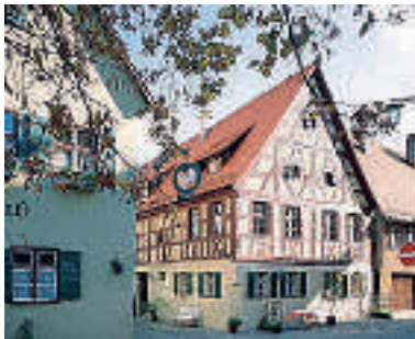
7 Flair Hotel-Gasthof Weißes Ross – Malerheim, Dinkelsbühl

9 D-74579 FICHTENAU-LAUTENBACH A 7 ab Ausfahrt 112 Dinkelsbühl/Fichtenau ca. 2 km Seehotel Storchennühle ☆☆☆☆ sehr ruhige Lage am Badesee, 20 B, EZ € 55,-, DZ € 80,-, inkl. Frühstücksbuffet, alle Zi mit Bad/Du, WC, TV und WLAN, gutbürgerliche Küche, P, Buckenweiler Str. 42, @, www.hotel-storchennuehle.de, ☎ +49 7962 9006-0, Fax 9006-29.