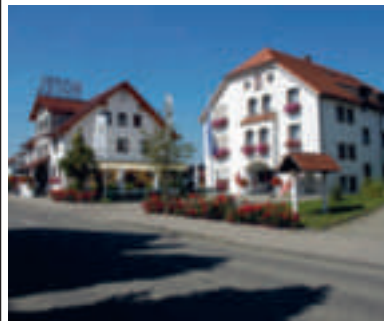
20 Hotel-Restaurant Adler, Westhausen