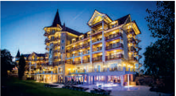
8 Vital-Hotel Meiser mit Gästehaus, Neustädtlein