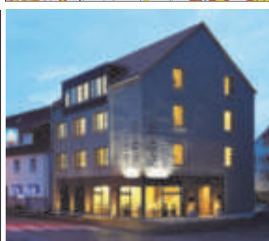
11 Sebcity Hotel, Ellwangen