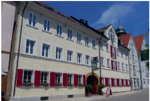
21 Hotel Restaurant Roter Ochsen, Lauchheim

29 D-89182 BERNSTADT A 7 ab Ausfahrt 119 Langenau ca. 6 km Landgasthof Waldhorn ☆☆☆ neu erbaut, ruhig gelegen, 24 B, EZ ab € 51,-, DZ ab € 73,-, Familien-Zi, inkl. Frühstück, alle Zi mit Du, WC, ☎, TV und WLAN, gutbürgerliche Küche, eigene Metzgerei, Räume bis 130 Personen, überdachte Terrasse, Bier- und Wintergarten, ☎, ☎, großer P, kein J., Hergasse 22, kontakt@landgasthof-waldhorn-noller.de, www.landgasthof-waldhorn-noller.de, ☎ +49 7348 949900, Fax 9499099.