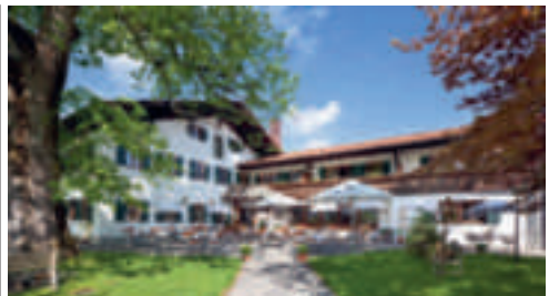
32 Landgasthof Gockelwirt, Eisenberg