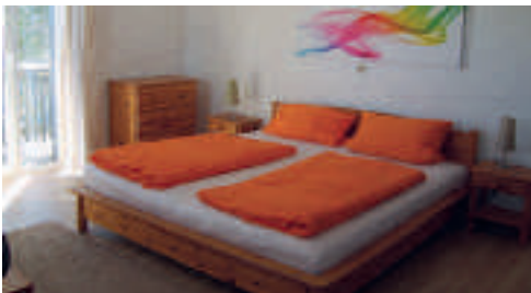
28 Pension Allgäu, Oy-Mittelberg