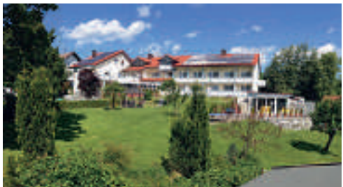
27 Naturhotel Am Sonnenhang, Oy-Mittelberg