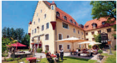
31 Schloss zu Hopferau, Hopferau

Kempten, die Metropole des Allgäus, bietet zahlreiche Freizeitaktivitäten für Jung und Alt. Dabei ist Kempten sehr zentral gelegen, sodass der Bodensee mit der Insel Mainau, die Königsschlösser mit dem bekannten Schloss Neuschwanstein oder das benachbarte Tannheimer Tal bequem erreichbar sind. Auch die Allgäuer Hochalpen mit der beeindruckenden Bergkulisse und der Nebelhornbahn, der höchsten Bergbahn im Allgäu, sind zum Greifen nahe und auf jeden Fall eine Besichtigung wert. Das Allgäu zeigt sich durch seine hervorragende Wetterlage das ganze Jahr von seiner besten Seite. Wussten Sie schon, dass im Allgäu die Sonne öfters scheint als sonst wo in Deutschland? Die perfekten Bedingungen für Entspannung, Erholung, Kultur erleben und Natur genießen, sind also erfüllt. Kempten ist ebenfalls ideal für Radurlauber geeignet. Die abwechslungsreiche Allgäuer Landschaft mit den sanften Hügeln der Voralpen, den malerischen Seen und viel ursprünglicher Natur gilt als Paradies für jeden Radfahrer. Somit ist die Stadt mit ihrer zentralen Lage und zahlreichen Radtour-Angeboten der perfekte Ausgangspunkt, um die schönsten Ecken des Allgäus zu entdecken.