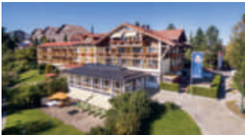
29 Parkhotel Tannenhof, Oy-Mittelberg