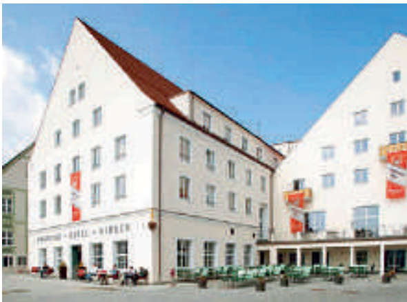
15 Brauerei Hotel Hirsch, Ottobeuren

Parkhotel Maximilian 218 B, Classic Zi ab € 67,50, Comfort Zi ab € 72,50, Deluxe Zi ab € 77,50, Junior Suite ab € 82,50, inkl. Frühstücksbuffet, alle Zi mit Du o. Badewanne, WC, Safe, Fön, Kosmetikspiegel, TV, ☎ +49 8332 92370, Fax 9327111.