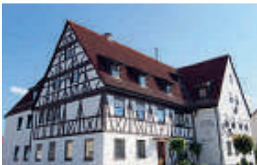
3 Hotel-Gasthof Rössle, Senden-Aufheim