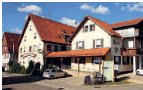
37 Hotel Krone, Nellingen