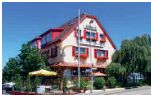
29 Hotel & Gourmet Restaurant Adler, Aichelberg

24 D-73730 ESSLINGEN A 8 ab Ausfahrt 54 Esslingen → Ostfildern ca. 8 km Businesshotel Rosenau ★★☆☆ familiengeführtes Hotel in 4. Generation, Ortsrand von Esslingen, 73 B, EZ ab € 59,-, DZ ab € 99,-, Mehrbett-Zi auf Anfrage, inkl. Frühstücksbuffet, alle Zi mit Du, WC, Fön, Sat-TV, schallisolierte Fenster, Radiowecker und kostenfreiem WLAN, Frühstücksraum, Bar, Terrasse, gemütlicher Rosengarten, Wellnessbereich mit Sauna, Dampfbad, Infrarotkabine in 8., ☎, P € 6,-, Plochingser Str. 65, @, www.hotel-rosenau.de, ☎ +49 711 3154560, Fax 31545677.