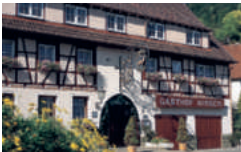
31 Gasthof Hirsch, Bad Ditzgenbach-Gosbach

lag in der Faszination für die unter der Wasseroberfläche existierende Diversität und fragile Komplexität eines auf den ersten Blick nicht wahrnehmbaren Lebensraums. Vor Ort muss sich der Mensch unter Wasser begeben und tauchen, um einen Eindruck von dieser Vielfalt und Einzigartigkeit zu bekommen. Im Panorama erschließt sich wie von einem Standpunkt unter dem Meeresspiegel aus die submarine Welt. In Farberläufen von Blau-, Azur- und Grünschattierungen bringt die Lichtbrechung im Ozean die fremde Welt der Korallen und Meerestiere vor allem nahe der Wasseroberfläche im Panoramabild zum Leuchten. Der Kunstraum komprimiert dabei eine Gegend, die halb so groß ist wie Frankreich. Es finden sich prototypische Naturräume ineinander verwoben, die in der realen Welt nicht nebeneinander existieren, sondern weit entfernt liegen oder sich in verschiedenen Wassertiefen befinden. Asisi hat einen hyperrealistischen Raum geschaffen, der erst im Panorama eine allumfassende Wahrnehmung des Korallenriffs ermöglicht. Auf mehreren Reisen und mit Hilfe des Dokumentarfilmers Ben Cropp hat sich Yadegar Asisi die Unterwasserwelt erschlossen. Zehntausende Unterwasserfotos und eine Sammlung künstlerischer Skizzen flossen in die Erstellung des Panoramas ein.