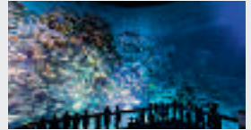
Great Barrier Reef Panorama Podest, Foto Tom Schulze © Asisi

Im 360°-Panorama GREAT BARRIER REEF entdecken Besucher die einzigartige Unterwasserwelt des Korallenriffs vor der Nordostküste von Australien. Die Motivation für das Projekt