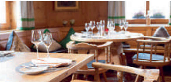
8 Hotel-Restaurant-Vinothek Lamm, Bad Herrenalb-Rotensol