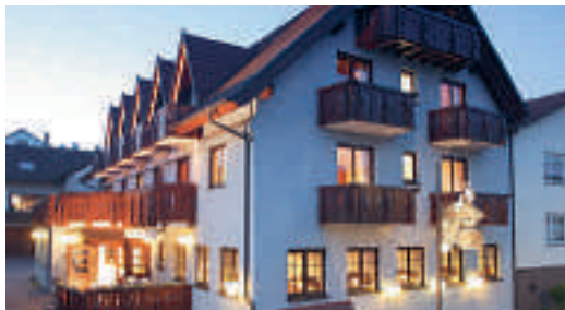
7 Hotel „La Cigogne“, Waldbronn-Busenbach

7 D-76337 WALDBRONN-BUSENBACH A 8 ab Ausfahrt 42 Karlsbad 2,5 km und A 5 ab Ausfahrt 47 Ettlingen ca. 7 km Hotel „La Cigogne“ ★★★★★ 18 B, EZ € 82,-, DZ € 115,-, inkl. Frühstücksbuffet, alle Zi mit Bad/Du, WC, ☎, TV, Fax-Anschluss und Balkon, Lift, Abendrestaurant, französisch-elsässische Küche, Räume bis 120 Personen, Tagungen, freier Eintritt im Thermalbad (500 m), saisonal Freibad und Eistreff, Tief-G, P, Ettlinger Straße 97, @ www.la-cigogne.de, ☎ +49 7243 565-20, Fax 565-256.