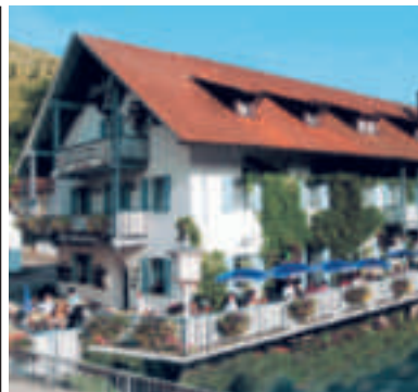
24 Landgasthof Zum alten Wirt am Schellenberg, Kinding-Enkering

Kostenlos die App „Hotel Guide“ für Ihr Smartphone downloaden!